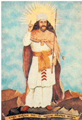
Zerdeşt ê ku hinek wî pêxember dibînin

Di wan demên zû de, ku gelê Israîlê ji aliyê Bailiyan ve hatibû binzorkirin û bi hezaran ji Israîliyan wekî koleyan ji niştê wan hatibûn hilkirin, navên pêxemberên Israîlî yên navdar li Rojhilata Navîn belav bûbûn: Hiziqyal , Jêrêmiya û Jêsaya , û li welatê Girîkan, li bajêrê Mîlet herdu fîlosof Thalês û Anaksîmander bingeha felsefeya sirûştî ya Iyonî avadikirin, û li Athêna Solon zagon nûdikir...di wê demê de jî li Iranê Zerdeşt ola kevnare ya gelên wan welatan taze dikir.