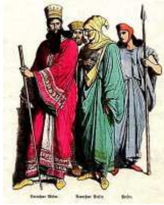
Hinek serekên Mîdiyan

Di wan demên zû de, ku gelê Israîlê ji aliyê Bailiyan ve hatibû binzorkirin û bi hezaran ji Israîliyan wekî koleyan ji niştê wan hatibûn hilkirin, navên pêxemberên Israîlî yên navdar li Rojhilata Navîn belav bûbûn: Hiziqyal , Jêrêmiya û Jêsaya , û li welatê Girîkan, li bajêrê Mîlet herdu fîlosof Thalês û Anaksîmander bingeha felsefeya sirûştî ya Iyonî avadikirin, û li Athêna Solon zagon nûdikir...di wê demê de jî li Iranê Zerdeşt ola kevnare ya gelên wan welatan taze dikir.